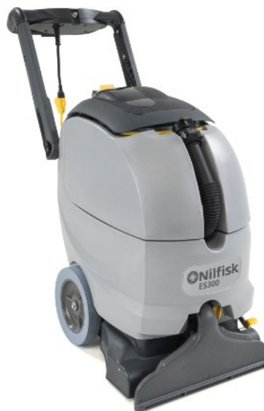
De getoonde afbeelding kan afwijken van het gekozen type

Een handig kenmerk van de Nilfisk ES300 tapijtreiniger is de aan de voorkant bevestigde afvoerslang, die het veel eenvoudiger maakt de tank te legen. De borstelkop zorgt voor meer contact met het tapijt en een verbeterde aanzuiging, waardoor het tapijt sneller droog is na het reinigen. Het compacte ontwerp maakt het eenvoudiger om de ES300 tapijtextractiemachine op te slaan en te onderhouden.