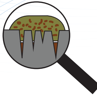
Bevochtiging met 'klassieke' reinigingsproducten